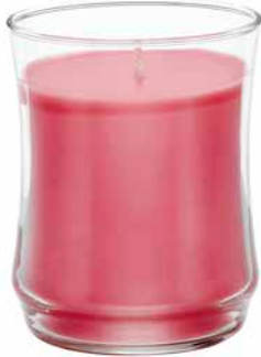
Duftwachsglas Essential Bellini G451018E 19,95€ 11,97 €