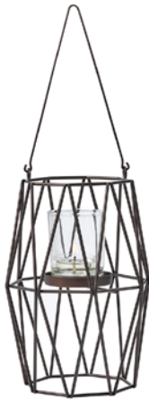
Votivkerzenhalter Trigon, zum Aufhängen Metall. Inkl. Klarglas für Votivkerzen und Teelichter. Auch für Maxi-Teelichter geeignet. H (inkl. Aufhängung): 35 cm, B: 13 cm. P93221 39,95 €