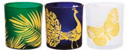
Teelichthalter Exotischer Garten, Trio Glas. H: 8 cm, B: 7 cm. P93431 34,95 €