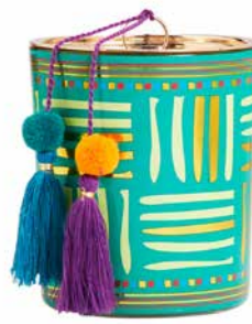
Duftwachsglas Borderless Brights™ Exotisches Hinoki-Holz G591091E 34,95€ 20,97 €