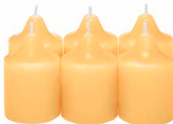
Duftvotivkerzen Mango-Mandarine, 6 St. V06154 10,45€ 6,27 €