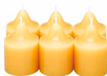
Duftvotivkerzen Ananas-Zuckerrohr, 6 St. V06926E 10,45€ 6,27 €