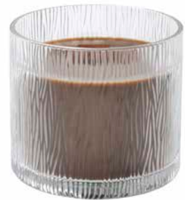
Nature's Light by PartyLite Duftwachsglas Kokos-Teakholz G461040E 42,95€ 25,77 €