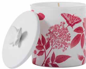
Duftwachsglas Frühlingszeit Himbeer-Rhabarber G961031E 19,95€ 11,97 €