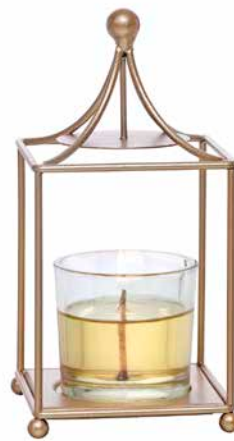
Votivkerzenhalter Champagner-Laterne Metall. Inkl. Klarglas für Votivkerzen und Teelichter. H: 15 cm, B: 8 cm P93013 29,90 €