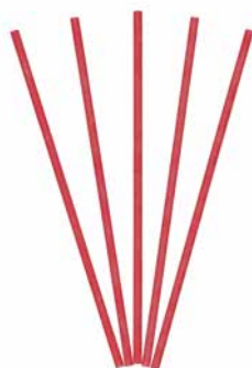
Smartscents Dekorative Duftsticks Himbeer-Rhabarber, 5 St. FS1031E 22,95€ 13,77 €