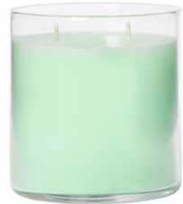
GloLite by PartyLite Duftwachsglas Zitronella-Minze G26B1093E 32,95€ 19,77 €