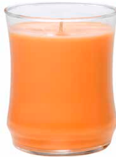
Duftwachsglas Essential Magische Mango G451038E 19,95€ 11,97 €