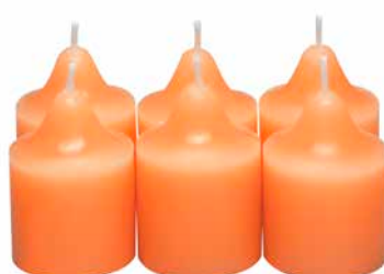
Duftvotivkerzen Magische Mango, 6 St. V061038 10,45€ 6,27 €