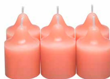
Duftvotivkerzen Fresh Home Tropische Brise, 6 St. V06B1011E 10,45€ 6,27 €