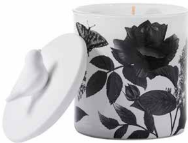
Duftwachsglas Frühlingszeit Weißer Flieder & Efeu G961029E 19,95€ 11,97 €