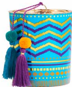
Duftwachsglas Borderless Brights™ Ingwer-Safran G591090E 34,95€ 20,97 €