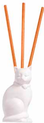
SmartScents by PartyLite™ Halter Kitty Keramik. H: 11 cm, B: 6 cm. P93456 14,95 €