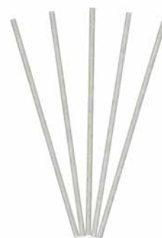
Smartscents Dekorative Duftsticks Vanille Kokosnuss, 5 St. FS929E 22,95€ 13,77 €