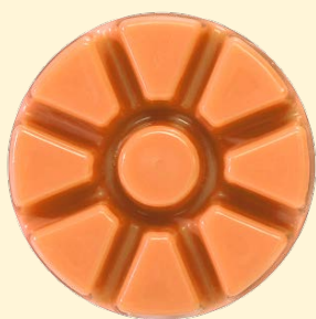
Scent Plus® Melts