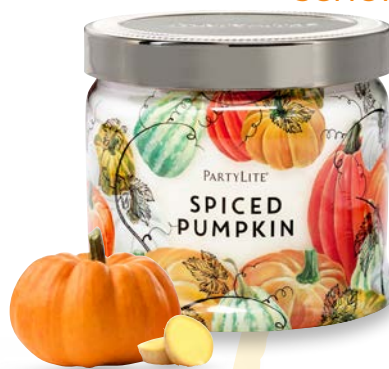
WÜRZIGER KÜRBIS G73B842E